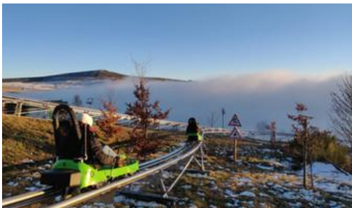
Bon plan sortie : Les Estables, la luge quatre saions.