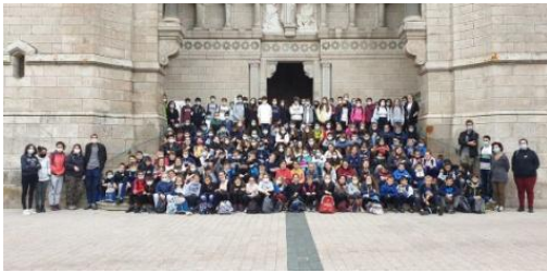
Une première sortie pour la rentrée : Lalouvesc.