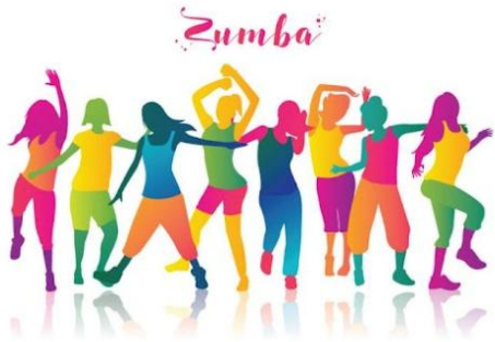
Après les fêtes le moment idéal pour commencer.