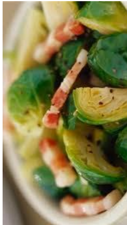
On a testé pour vous le meilleur et le pire des repas de Noël